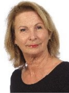
Woonplaats: Appingedam Leeftijd: 64 jaar