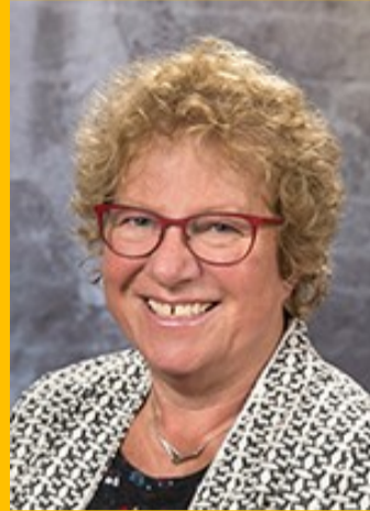
Woonplaats: Woldendorp Leeftijd: 65 jaar