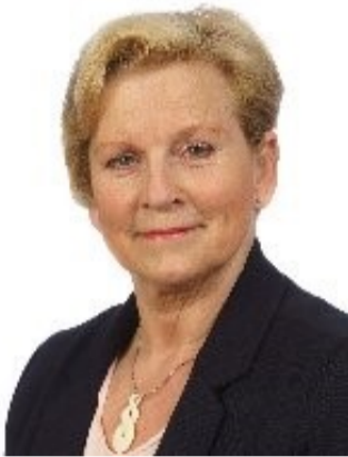
Woonplaats: Appingedam Leeftijd: 63 jaar